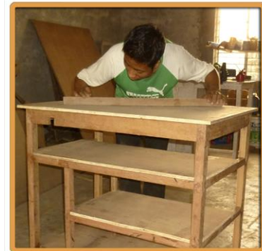
Jugendliche in Kolkata beim praktischen Unterricht