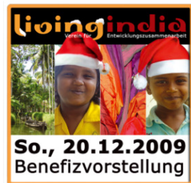
Benefizkonzert zu Gunsten von LIVING INDIA

Die Einnahmen an diesem Abend kommen LIVING INDIA zugute. Wir freuen uns auf Ihr Kommen und danken für Ihre Unterstützung.