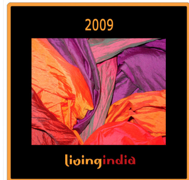
LIVING INDIA Wandkalender 2009 (A3)

Bei rascher Bestellung geht sich auch die Lieferung noch rechtzeitig aus. Warten Sie also nicht zu lange und informieren Sie sich über die Ideen von LIVING INDIA auf www.living-india.at